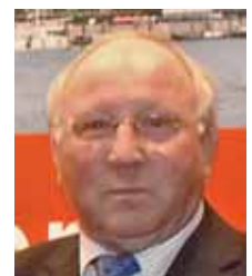
Uwe Seeler, Kuratoriumsmitglied und Gründer der Uwe-Seeler-Stiftung

„Wer auf der Sonnenseite des Lebens ist, der sollte jenen etwas abgeben, die auf der Schattenseite des Lebens stehen. Daher bin ich selbst Stifter und engagiere mich für die Idee der Haspa Hamburg Stiftung.“