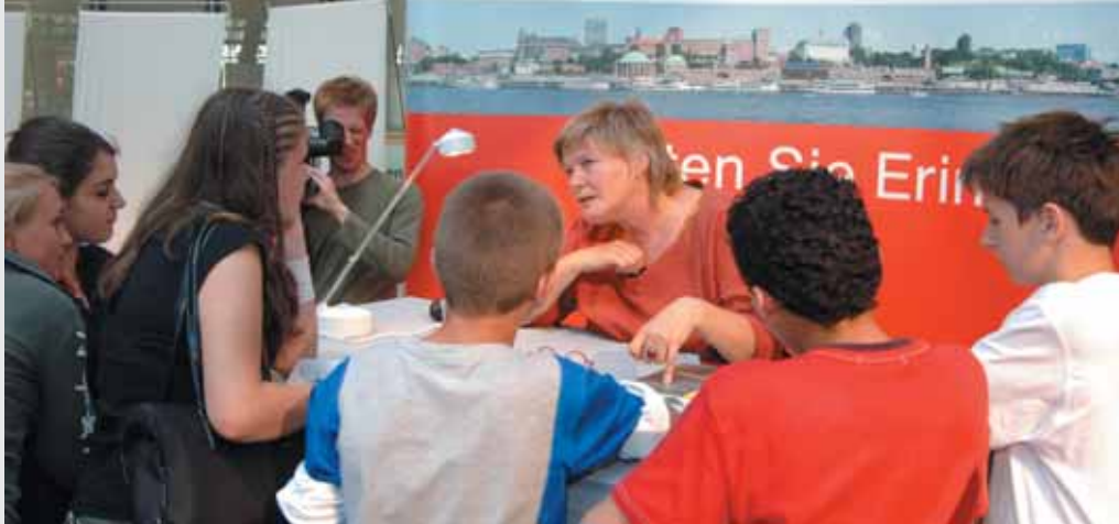
Die Aktion „Spaß am Lesen“ verdankt ihren Erfolg prominenten Kinderbuch-Autoren, u. a. Jutta Richter.