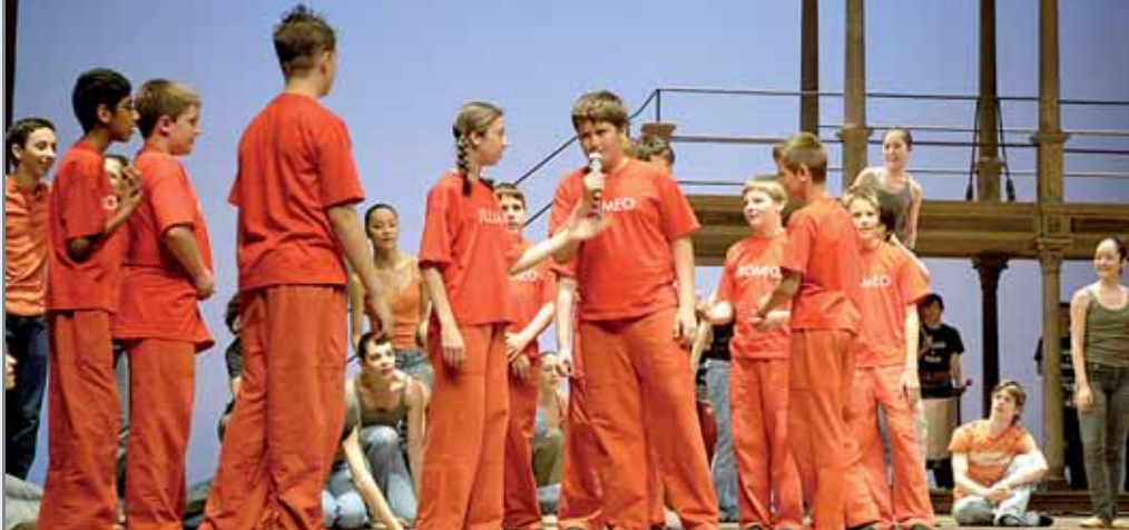
Hamburgs Ballett-Chef John Neumeier entwickelte das Tanz- und Musikprojekt „Focus on YOUth“ zu einem einzigartigen Ereignis.

Finanzierung der Baukosten wird von der Behörde für Bildung und Sport, dem Schulverein und auch von zwei Stiftungen (ZEIT-Stiftung und Haspa Hamburg Stiftung) getragen. Der kostenlose Entwurf stammt von dem renommierten Architektenbüro Bothe Richter Teherani.